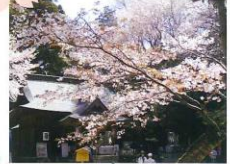
⑧ 磯部桜川公園 国指定文化財 名勝・天然記念物「桜川のサクラ」 山桜、染井吉野他 (4月上旬～中旬)