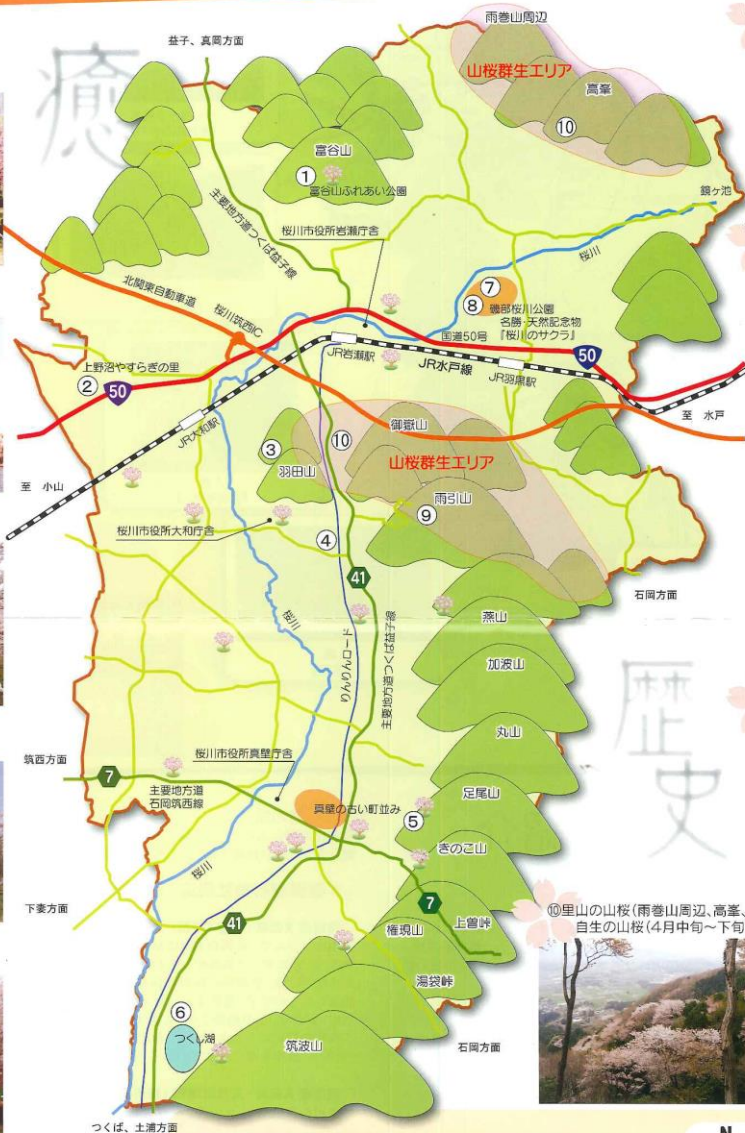
⑦ 磯部稲村社周辺 山桜他 (4月上旬～中旬)