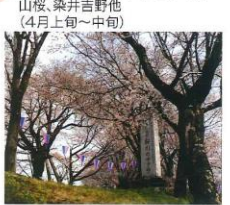
⑨ 雨引山の桜 染井吉野、山桜他 (4月上旬～中旬) 河津桜 (3月中旬)